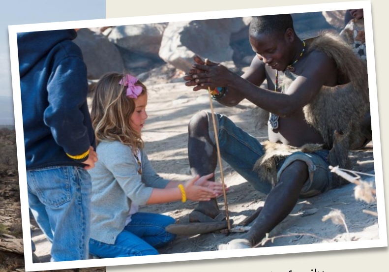
Travellers visiting a Hadzabe family